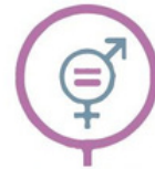
Igualdad de género