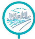
Cohesión social y territorial